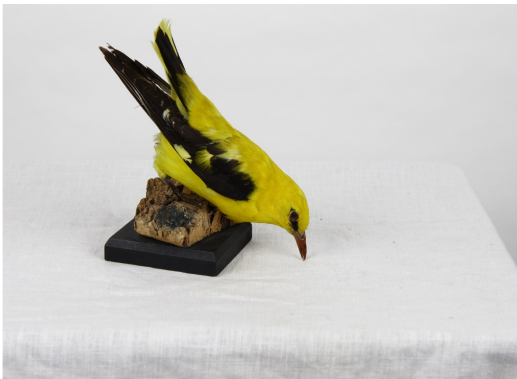
Pirol, Vogelpräparat im Naturkundemuseum der Kant. Mittelschule Uri