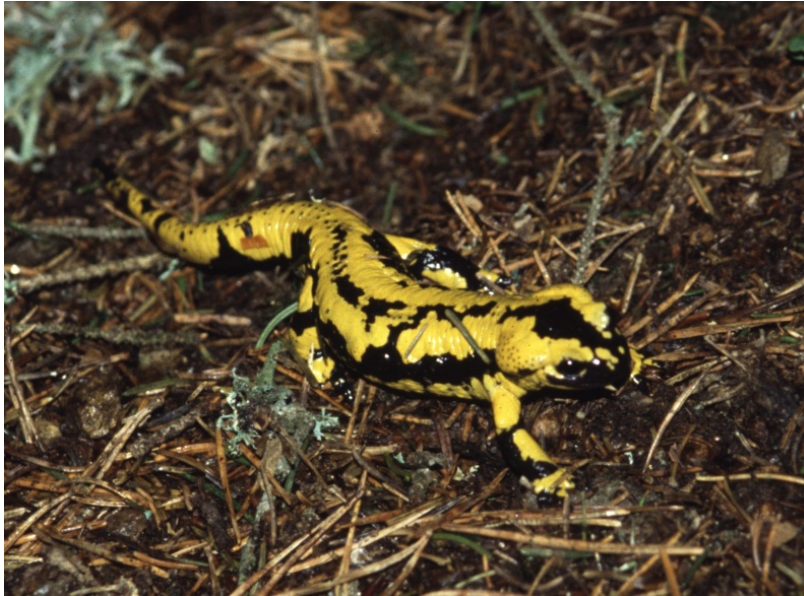
Feuersalamander in den Urnerfarben