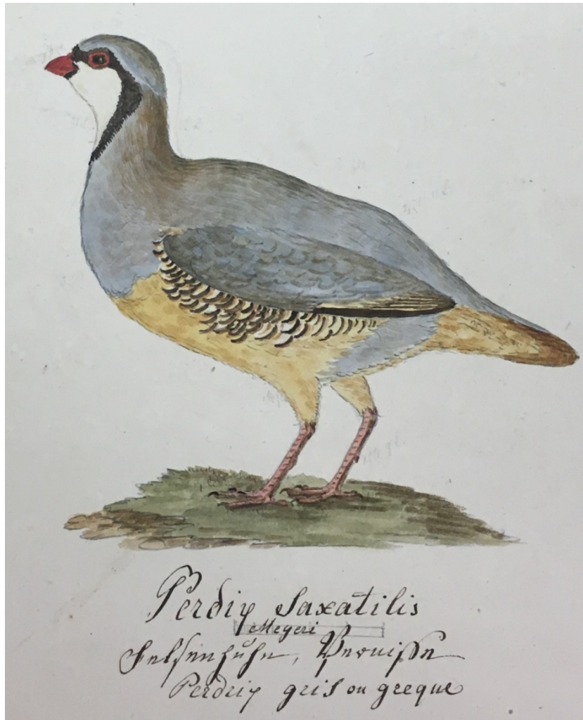
Karl Franz Lusser: Zeichnung eines Steinhuhns